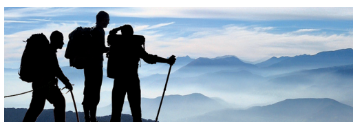
montbleu Sherpa Actions françaises - Éligible au PEA et au PEA-PME

« Investir dans la valeur des PME françaises »