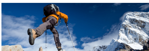
D.Fi Diversité Flexible International - Fonds de fonds

Charles de Sivry, gérant de montbleu Sherpa