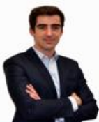
Charles POINSINET DE SIVRY